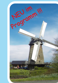
NEU im Programm !!!

Wie schon bei unserer erprobten "Lipperlandfahrt" geht es erneut auf eine Ganztages-Tour, diesmal durch den Nachbarkreis. Ergänzt durch eine gesellige Mittagspause gibt es auch jenseits des Wiehens viel Spannendes zu entdecken.